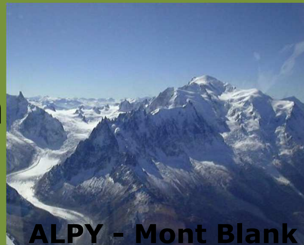
ALPY - Mont Blank