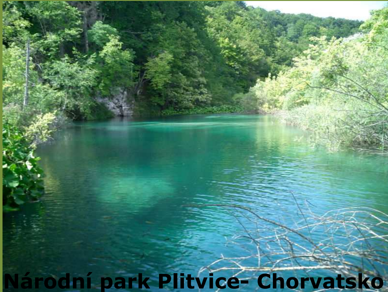
Národní park Plitvice- Chorvatsko

Nejzachovalejší a nejméně poškozená příroda je chráněna v rezervacích a národních parcích